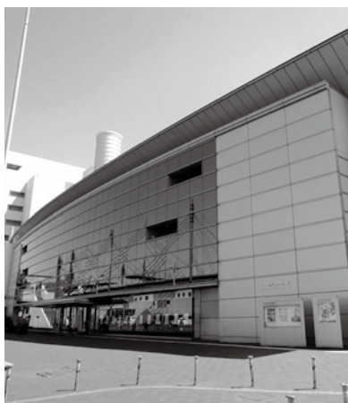
西日本総合展示場 新館