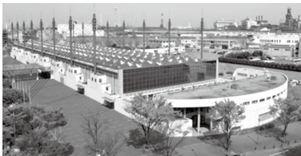
西日本総合展示場 本館(大展示場)