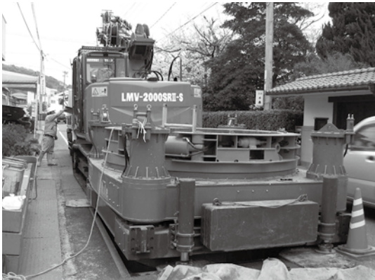
写真-1 LMV-2000SR IISの外観