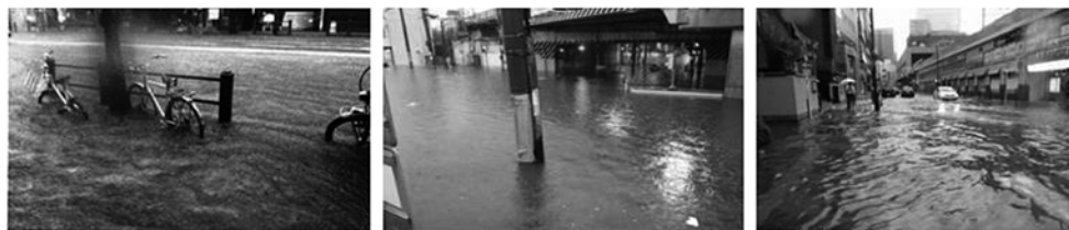
平成23年8月27日の浸水状況 (大阪市中心部)