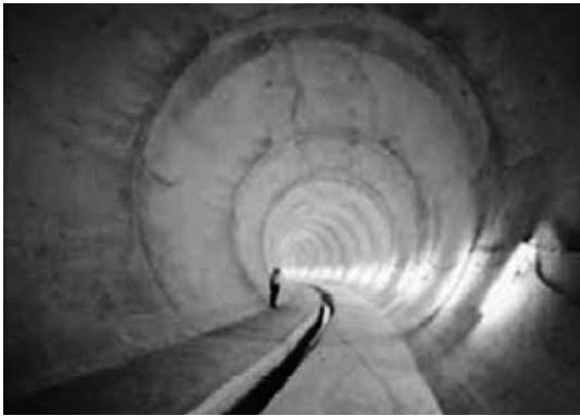
写真-1 小机千若雨水幹線内状況