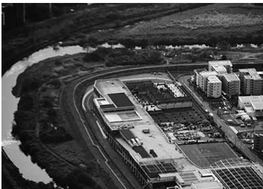
写真-2 新羽雨水調整池