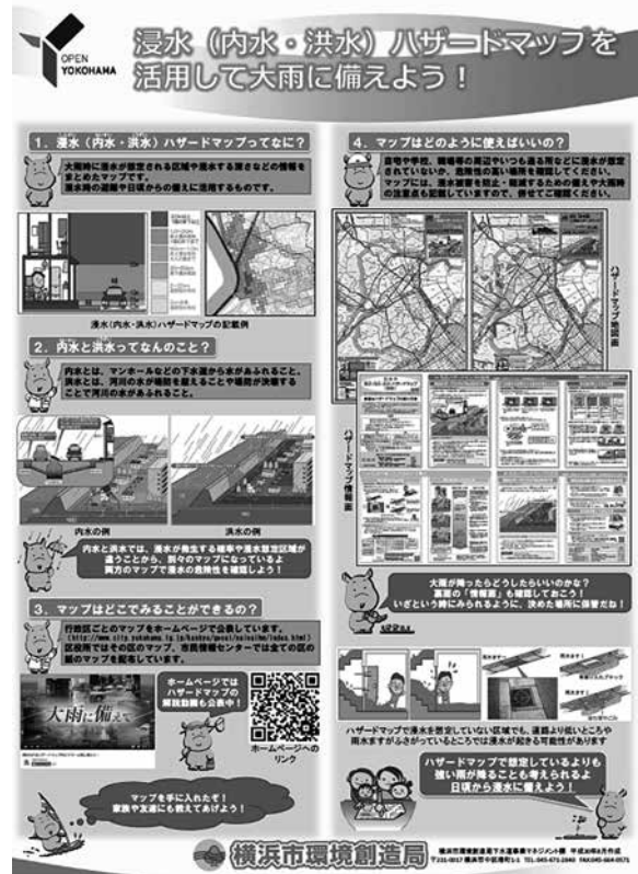
図-3 浸水(内水・洪水)ハザードマップPR資料