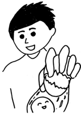
図-2 片手で卵が割れます

大事な話の後で何も質問が出ない、という場面がある。これは聞いているほうが「ヒトゴト」だと思っている証拠である。これでは技術というバトンは、受けとってもらえない。そこで、バトンを受けとって走り続けてもらうためにはいくつかの工夫がいる。