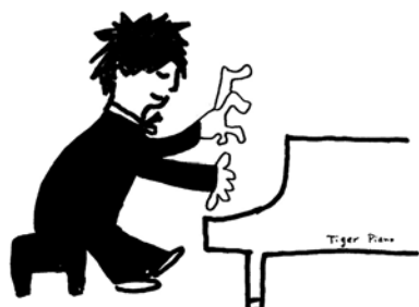
図-1 超絶技巧の伝承は難しい

フィギュアスケートの4回転半とか、ピアノの超絶技巧などの「伝承」は難しい。超有名人の絶妙で芸術的なワザなどは「余人を持って代えがたい」ということになって「名選手とか名演奏家」という名前だけが残り、そのワザは「伝承」されずにビデオ映像のみが歴史的資産となるほかはない(図-1)。