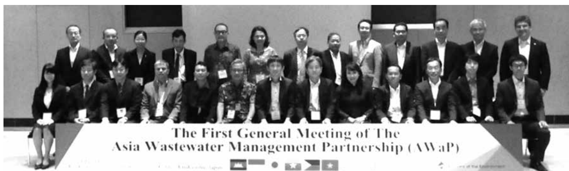
写真-1 アジア汚水管理パートナーシップ第1回総会

では汚水処理率が9割を超え、水質問題はかなり改善されてきました。今後は、これまでに得た汚水処理に関する経験やノウハウを活用し、アジアの国々の汚水処理を促進することが日本に求められています。