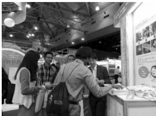
写真-2 国際会議でのプレゼン

水ビジネスの国際展開を進めるためには、日本企業との連携が欠かせません。国土交通省は海外での現地調査・国際協力活動において得られた情報を集約した