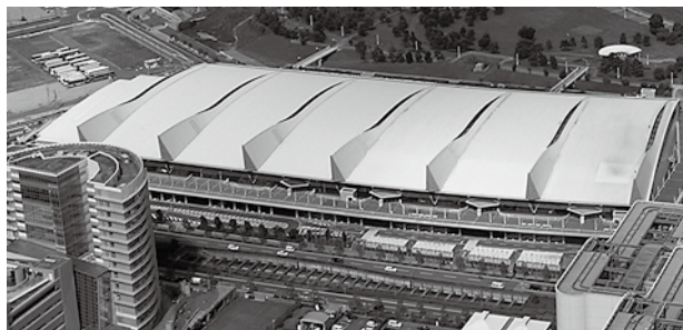
パシフィコ横浜 展示ホール / アネックスホール